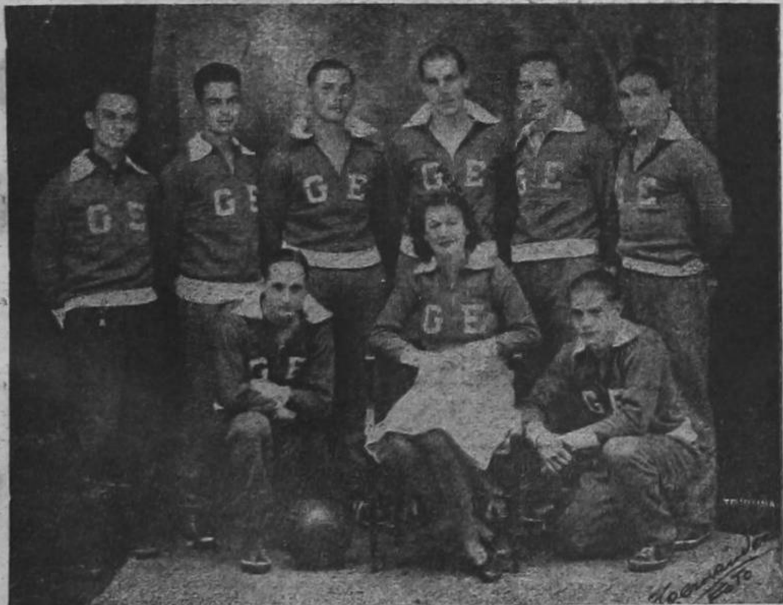
Primer equipo de la Sociedad Gimnástica Española cuya gira a El Salvador a mediados de febrero, ha quedado concertada.

CIUDAD DE MEXICO, 5. — El ministerio del interior ha rechazado la solicitud hecha por numerosos refugiados españoles para que se les permita traer sus familiares que actualmente están en campos de concentración en Francia. El ministro declara que lamenta tener que rehusar ese permiso, pero lo hace basado en que los refugiados carecen de medios económicos para sostener a sus familias y por lo tanto el estado mexicano tendría que asumir la responsabilidad de su mantenimiento.